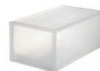
ポリプロピレン衣装ケース引出式 (深) 約幅400×奥行650×高さ300mm